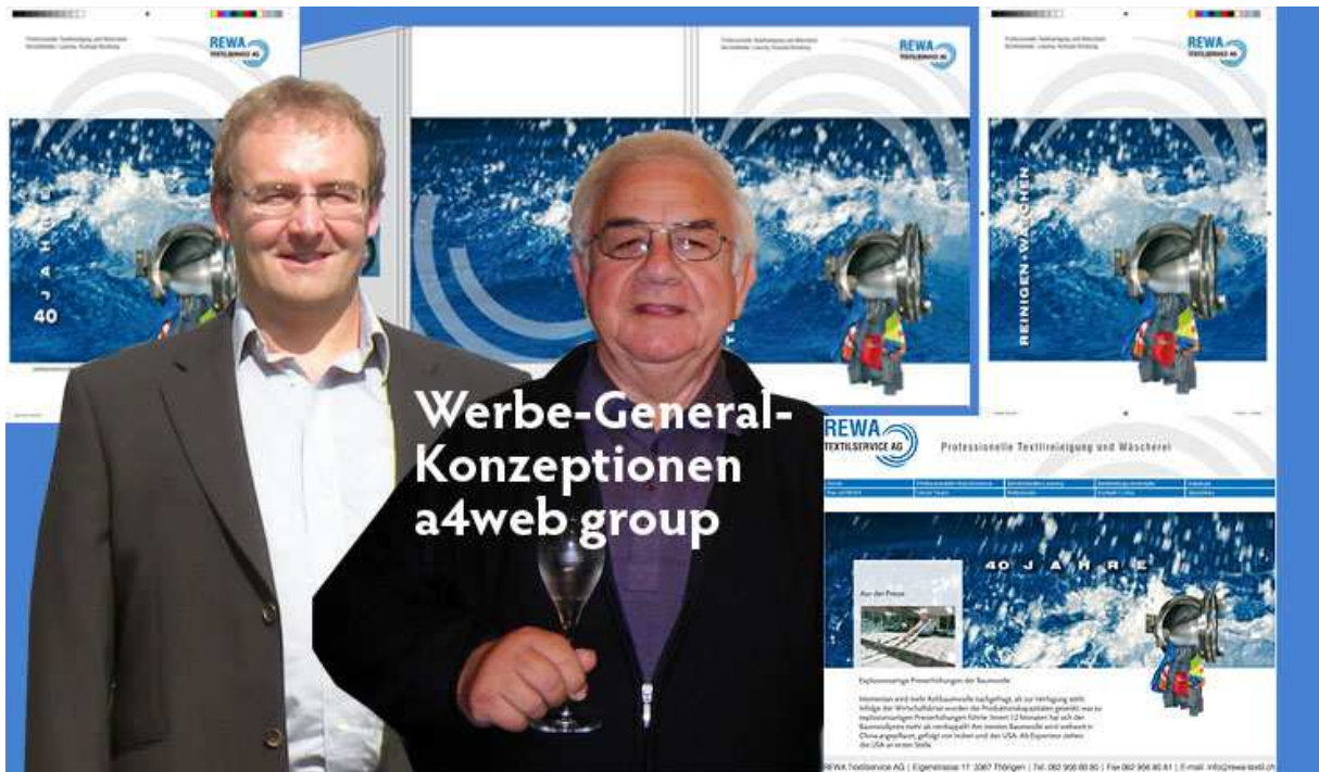
Foto: General-Konzeption für Erfolg für Ihre Firma (neues Corporate Identity total)